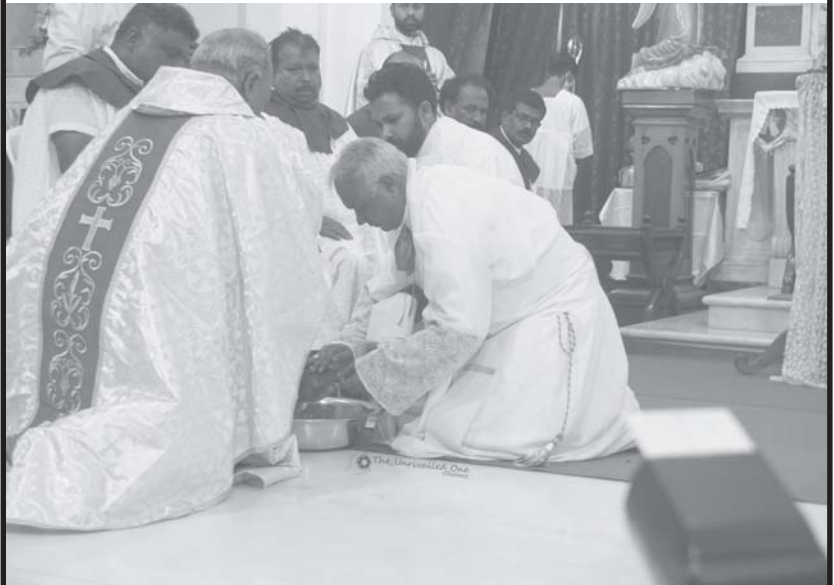
പെസഹ വ്യാഴാഴ്ചയിലെ പാദം കഴുകൽ