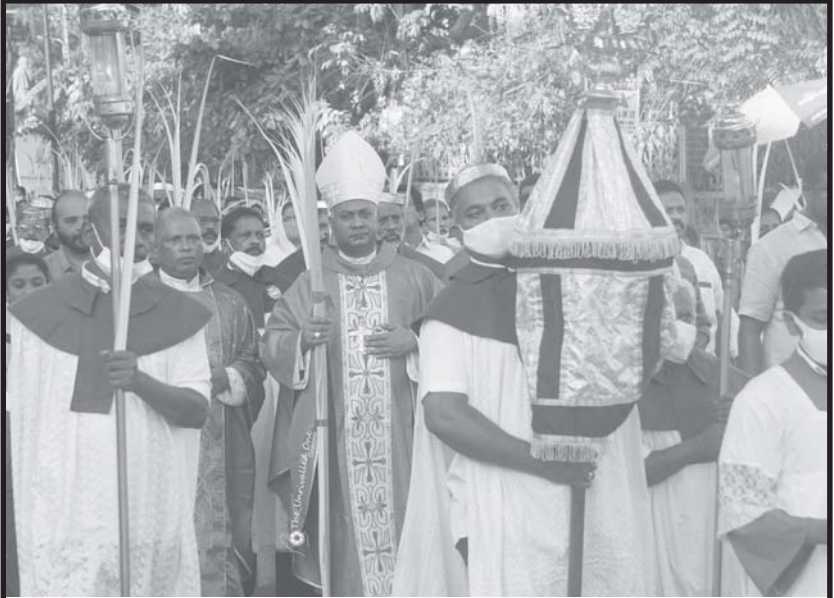
ഓരാന ഞായർ പ്രദക്ഷിണം